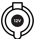
12V DC Cigarettändaruttag